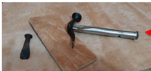
Imagem11: Ferramentas martelo rebaixo por meio das batidas com o martelo próprio de seleiro

Martelo para seleiro usado com os rebaixos.