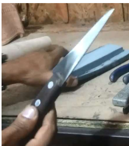
Imagem 4: A faca e a pedra de amolar faca

Enquanto ele explica vai demonstrando cada instrumento e seu uso, como faca, a suvela e a costura pronta que é usado esse instrumento conforme imagens 4 e 5 a seguir.