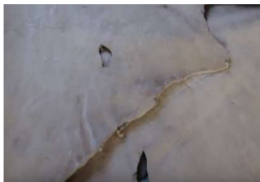
Imagem 1: Sola de couro curtido da região de Ipirá – Tucano para confecção de artefatos.

No processo de produção o artesão do couro conhece todas as etapas da produção e confecciona participando de cada uma dela, se tornando um produto único, desde a escolha do tipo de couro, do desenho do molde, da modelagem, da costura, aos ornamentos.