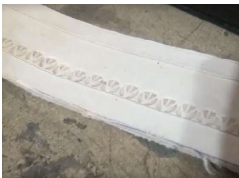
Imagem 13: Detalhe do rebaixo usando o instrumento de rebeixo com forma de “pé de galinha” feito no couro.

Neste momento ele chama atenção para o som do martelo no ferro, para a produção do desenho em rebaixo, que para ele são músicas para o ouvido. Na imagem abaixo a sequência de rebaixos transmitindo textura, profundidade e volume ao desenho, aplicado de forma linear pelo ferro de rebaixo.