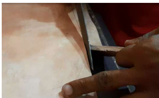
Imagem 8: Técnica de Fábio Sela para o corte do couro.