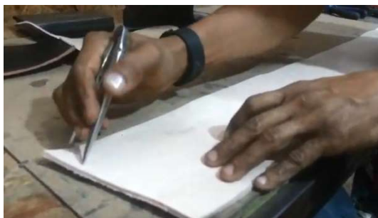
Imagem 9: O compasso nas mão de Fábio Sela ao projetar o seu desenho no couro de boi que é mais grosso, para cortar a correia.