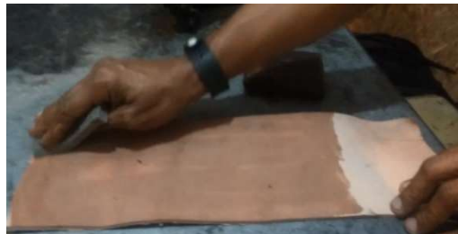
Imagem 6: Molhando o couro por meio do gesto.

Um dos primeiros procedimentos é o de pressionar sobre o couro que é feito pelos gestos de Fábio Sela. Na imagem 6 é o registro do procedimento de passar uma esponja com água sobre o couro fazendo movimentos contínuos de cima para baixo e ao contrário.