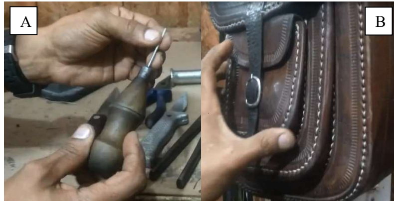
Imagem 5: A suvela (A) e a bolsa com o detalhe com costura na qual para fazer é necessário o uso da suvela para perfurar, agulha e a linha para costurar no local perfurado pela suvela (B).