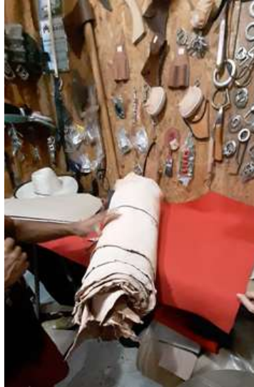
Imagem 2: A matéria-prima da forma que chega para Fábio Sela, o couro.