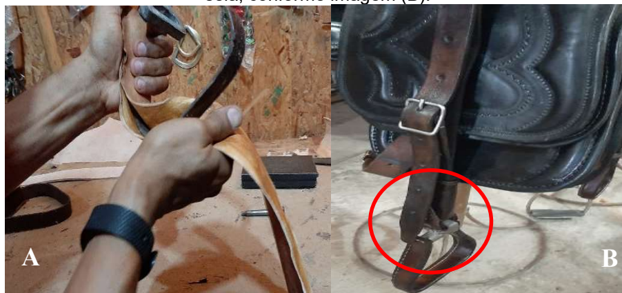
Imagem 3: Fábio Sela revestindo com couro o estribo da sela (A) e peça em destaque finalizada na sela, conforme imagem (B).