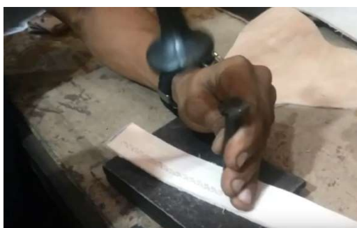
Imagem 12: Fábio Sela utilizando uma placa de ferro, martelo e o ferro para rebaixo sobre o couro ornando o couro.