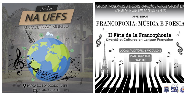
Figura 2, Exemplo de cartazes criados pela bolsista