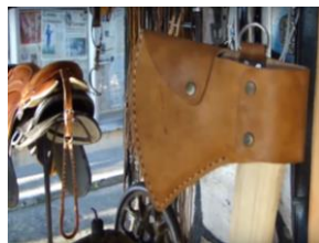
Figura 11: Capa em couro para machado, feita pelo artesão Fabio Sela.

https://www.youtube.com/watch?v=_e1WI-Qv9O0