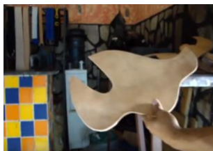
Figura 5: Recorte em couro produzido por Fabio Sela. Desenho do couro, para a sela por meio do molde.