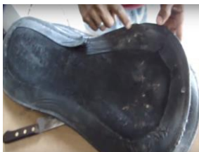
Figura 6: Artesão do couro Fabio confeccionando a sela.

https://www.youtube.com/watch?v=_e1WI-Qv9O0