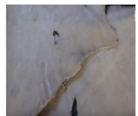
Figura 4: Sola, couro curtido em Ipirá - Tucano. Para produção dos artefatos.