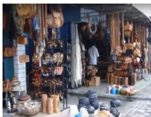
Figura 1: Centro de Abastecimento de Feira de Santana – Bahia, Setor do artesanato.