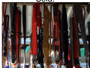
Figura 10: Bainha de facão produzida em couro, feita por Fábio Sela.

https://www.youtube.com/watch?v=_e1WI-Qv9O0