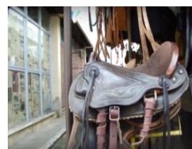
Figura 8: Sela Australiana feita pelo artesão Fabio Sela.

https://www.youtube.com/watch?v=_e1WI-Qv9O0