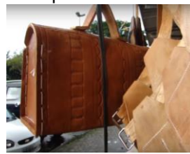
Figura 12: maleta de ferramenta em couro feita por Fabio Sela.

https://www.youtube.com/watch?v=_e1WI-Qv9O0