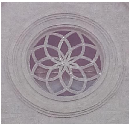
Figura 2 – Rosácea central da fachada da Igreja Senhor dos Passos