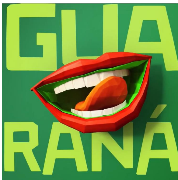
Figura 04 – A boca 2