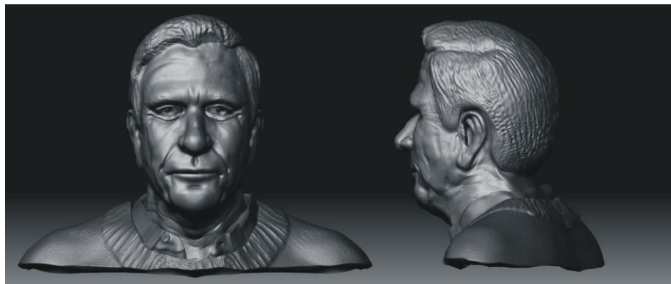
Figura 01 - Modelagem digital