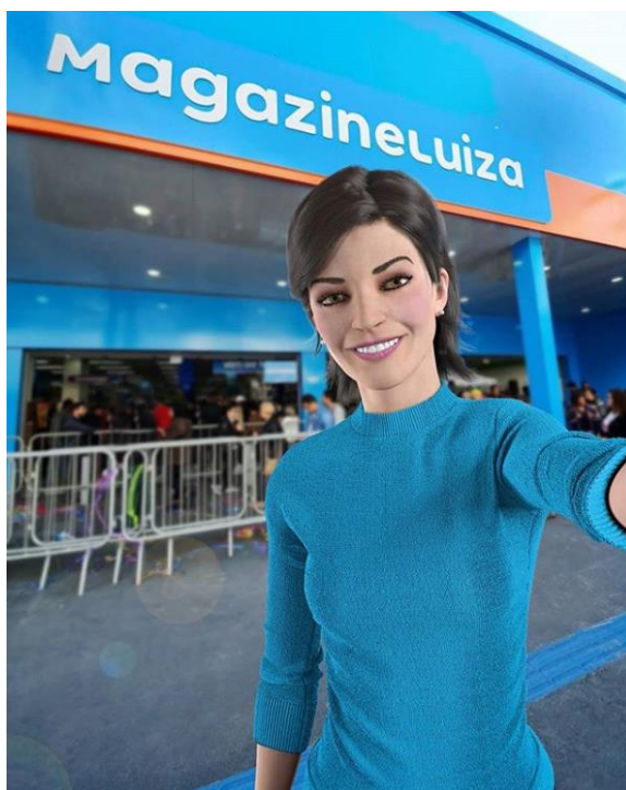
Figura 03 – Lu da empresa Magazine Luiza 1