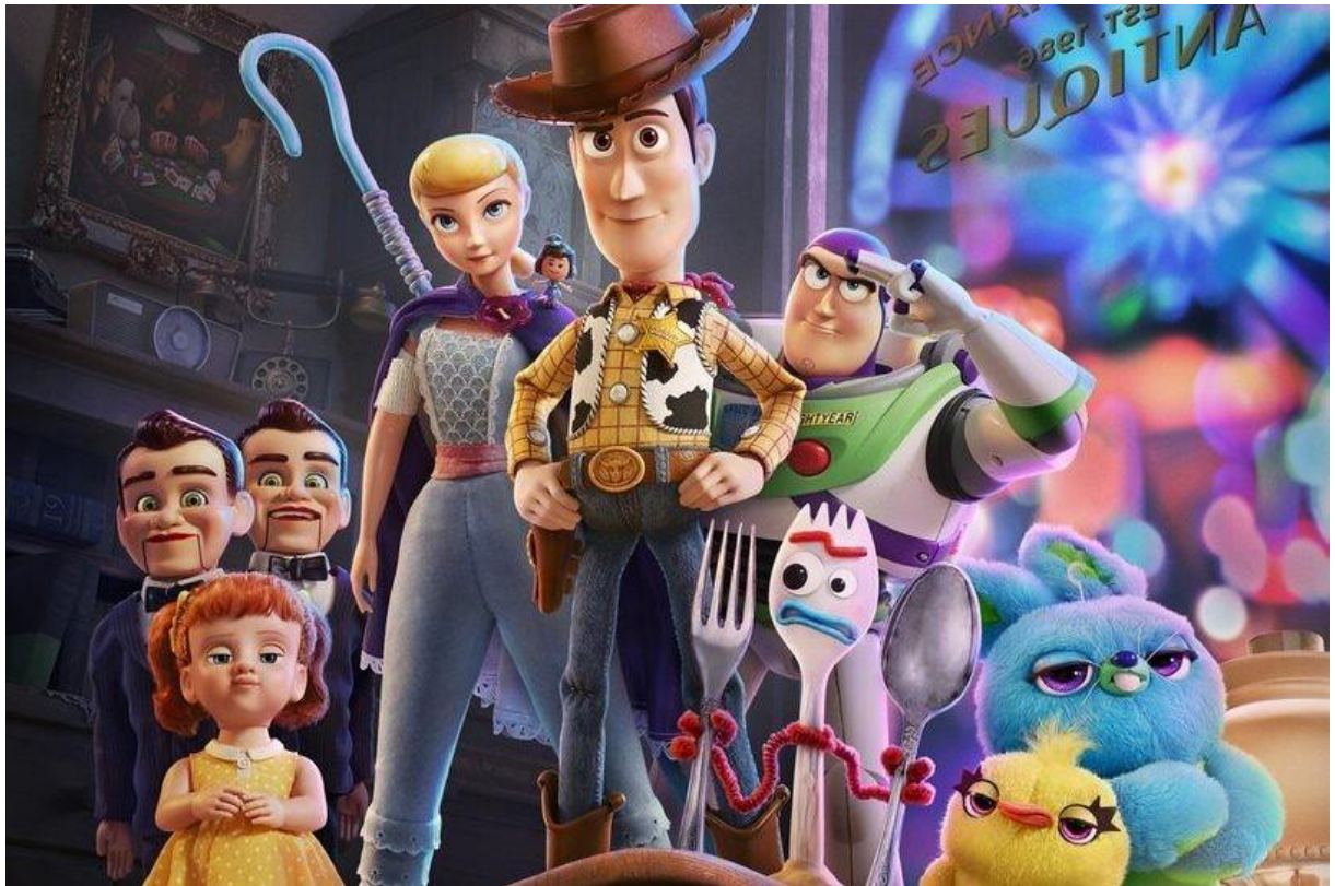
Figura 02 - Animação digital: Toy Story 4