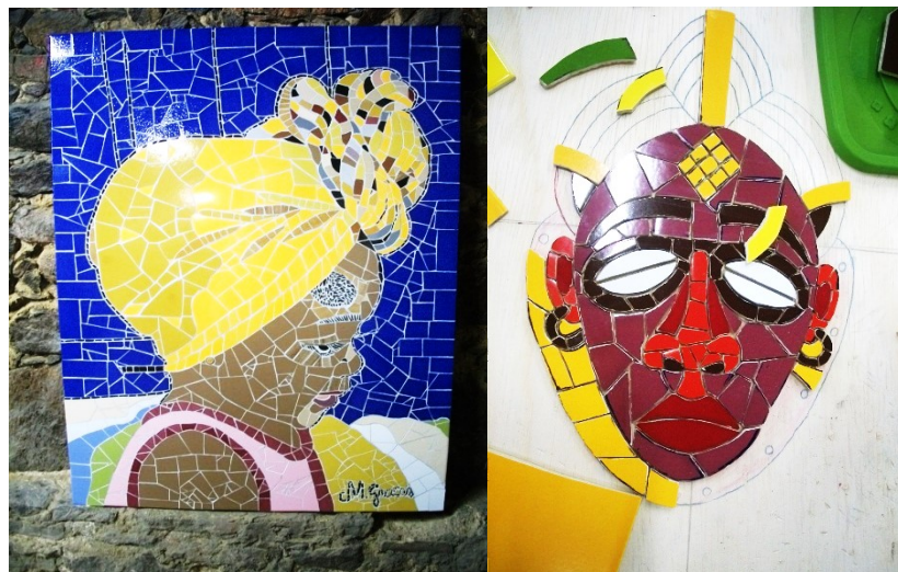
Figura 3. Trabalhos dos alunos de mosaico intermediário. 2016/2017

Observa-se, também, com a produção do mosaico e a técnica de encaixe e quebra-cabeça, conforme a figura 3, que o espaço e o tempo são características peculiares no encontro de soluções técnicas, com instrumentos específicos. Segundo, Dewey isso mostra que os materiais possuem suas qualidades.