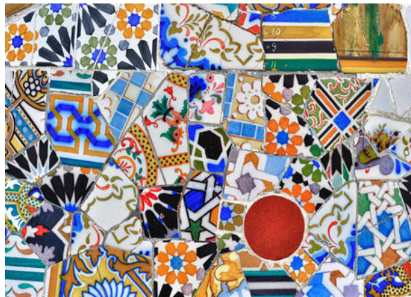
Figura 1: Antoni Gaudí. Detalhe do mosaico Parque Guell, Barcelona. Fonte: ZERBST, 2003, p. 154.

As obras de Gaudí demonstram, pela nossa abordagem histórica, em sala de aula, o reaparecimento da expressão acentuada de vitalidade das cores e organização das peças. O espaço de produção envolve o aluno na experiência caracterizada pela consciência do fazer em retomada aos princípios artesanais. Envolvidos, também, por leituras de imagens das obras em mosaico dos artistas, como Carybé, Di Cavalcanti, Antônio Carelli, Serafino Faro, Bramante Buffoni (RUAS, 2014). Entretanto, o espaço de produção “CUCA/OCA” é, também, motivo de influência e continuidade na construção das obras.