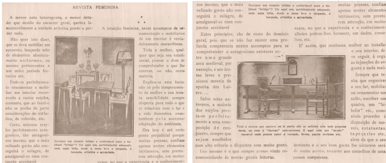
Figuras 3 e 4: “A esthetica dos interiores” em Revista Feminina, n.115, 1923.

Tomando como exemplo a relação entre a decoração e o papel da mulher, apresenta-se a publicação de dezembro de 1923 da “Revista Feminina” mais especificamente na página 88 cuja matéria se intitula: “A Esthetica dos interiores”.