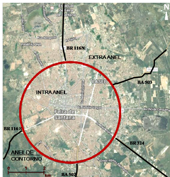
Figura 2: Desenho da cidade de Feira de Santana em 2017.