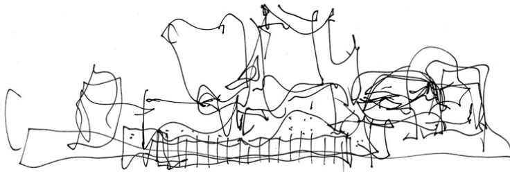
Figura 1: Walt Disney Concert Hall, Los Angeles, California . Arquiteto Frank Gehry.