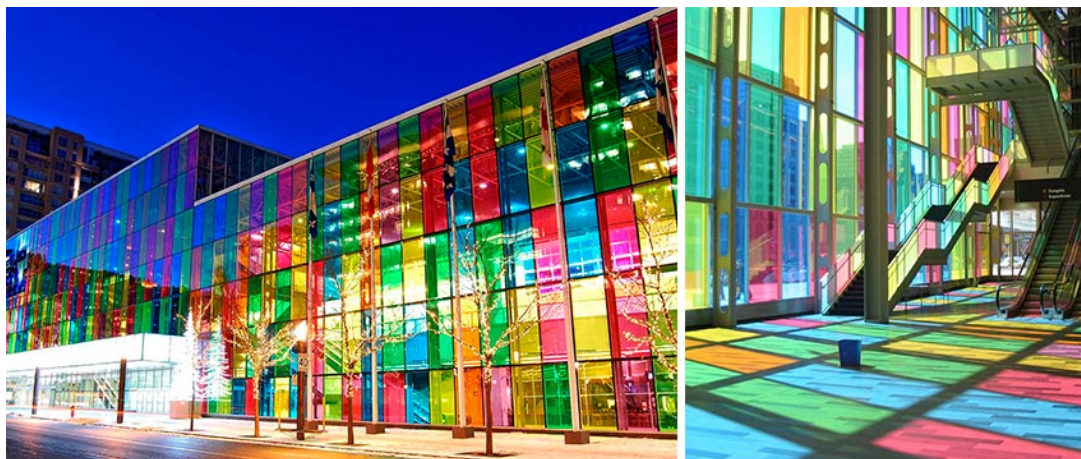
Figura 5: Pixel Building em Melbourne, Austrália

de radiações solares e torna o ambiente interno mais aquecido. Logo, torna-se contraditório colocar esse modelo de edificação em países de clima tropical como o Brasil.