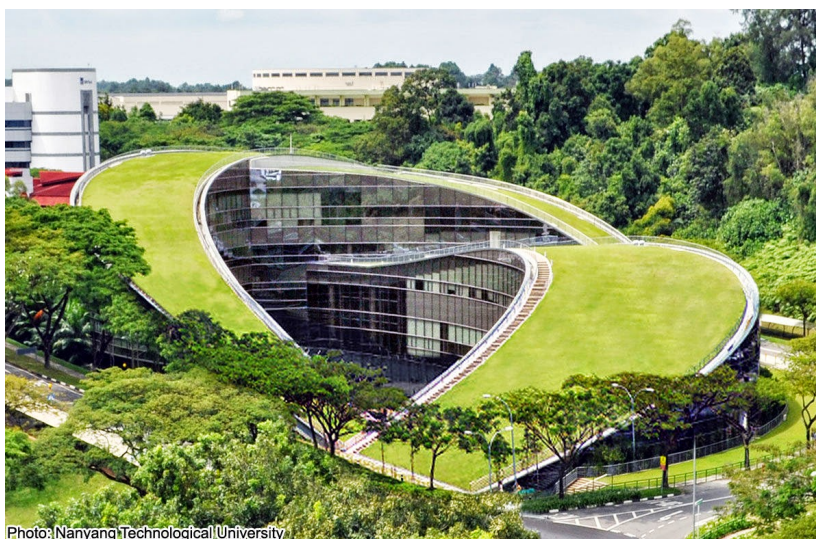
Figura 3: School of Art, Design & Media at Nanyang Technological University campus, Singapore.

Preocupados em oferecer um ambiente mais harmônico, saudável e confortável, aos usuários, esses projetos visam adequar-se ao local inserido, a paisagem do entorno, a cultura regional, os materiais construtivos disponíveis, fatores sociais, econômicos, políticos e, principalmente, ao seu macroclima e microclima.