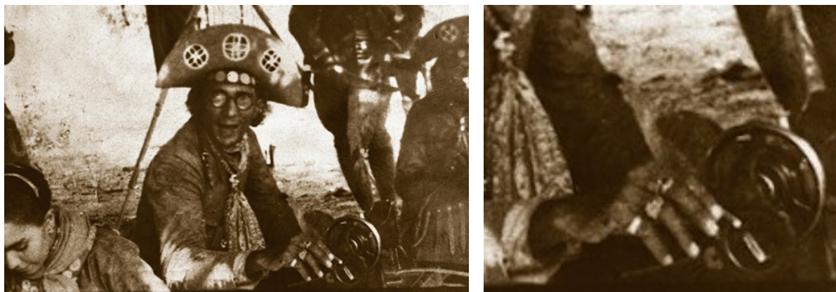
Imagem 3 – Lampião costurando