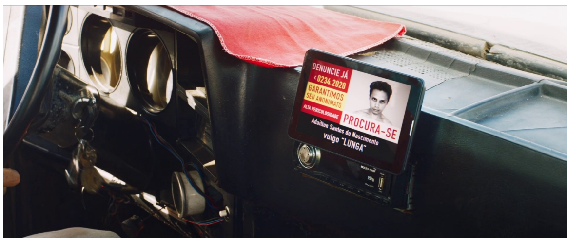
Imagem 1 – Lunga procurado

Antes de sua entrada em ação, a única imagem que temos da figura de Lunga é a de uma fotografia em preto e branco de seu rosto, com uma expressão séria e um olhar agressivo, enquadrado em um anúncio de “procura-se” que está passando em uma tela de tablet fixada no painel do caminhão-pipa no início do filme (imagem 1).