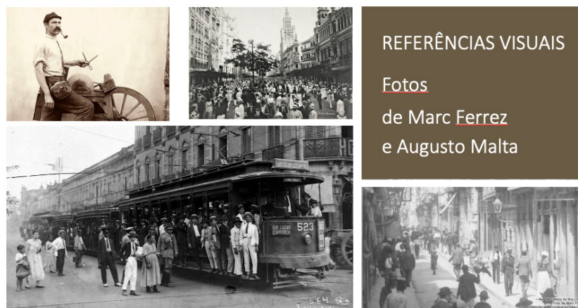
Figura 1: Exemplos de fotos de Marc Ferrez e Augusto Malta pesquisadas para o projeto.

as quais servem de referência para o desenho das personagens, cenários e ambientação da obra (figura 1).