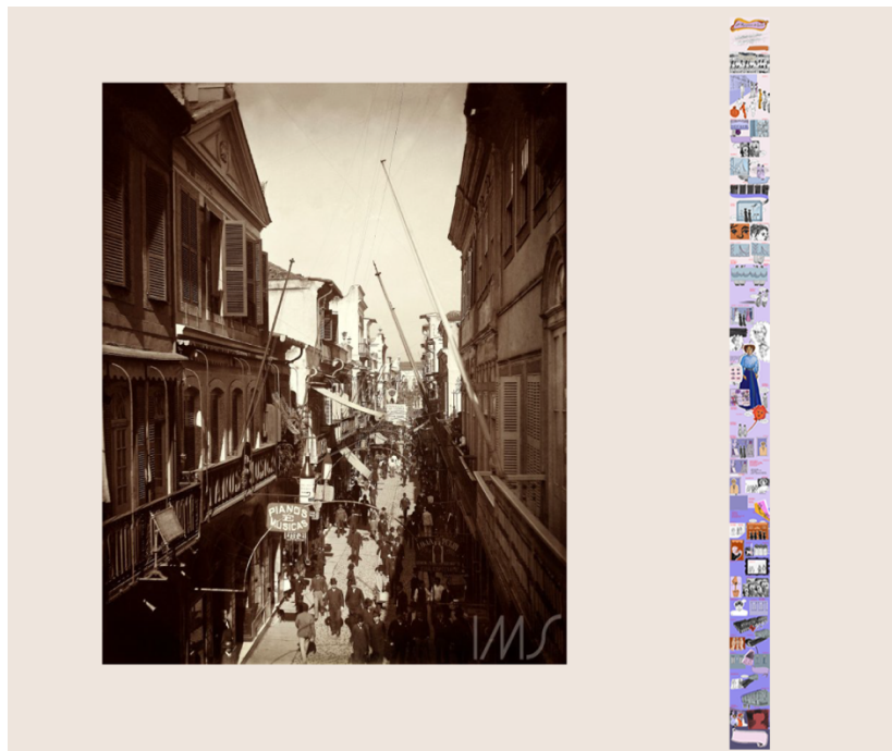
Figura 2: Comparação do formato da Rua do Ouvidor (à esquerda foto de Marc Ferrez, circa 1890) com o formato da webcomic em tela infinita da releitura de “As Mariposas do Luxo” (desenho à direita).

estética de esboços, reforçando a ideia de simularem terem sido feitos na rua, paralelamente ao desenrolar da narrativa.