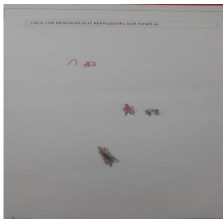
Imagem 02- Desenho que representa a sua família. Fonte: Aluno autista V. 7 anos (aula presencial, 2022)

O desenho possibilita essa comunicação, “Desenhar é comunicar-se, é fazer-se entendido e compreendido, mesmo que em silêncio, sem sonoridade da fala”. (LIMA, 2021, p. 69). A intenção de representar o real permite que a criança estimule o seu imaginário.