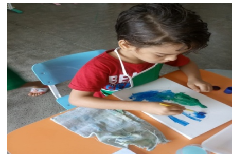
Imagem 01: Releitura da obra de Abaporu de Tarsila do Amaral

A professora desenhou na tela como meio de auxiliar o aluno, para que o mesmo conseguisse trabalhar à sua maneira, fazendo uma pintura autoral pela escolha das tintas, “Essas atividades artísticas que podem contribuir com a inclusão do indivíduo com TEA em seu meio, dando oportunidades para que o seu cérebro seja estimulado, [...] possa por alguns instantes ser levado a perceber, [...] mundo que nos cerca. (FERNANDES. 2010. p.56)”.