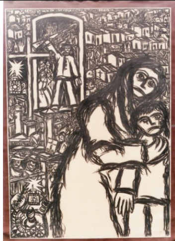
Figura 01 – CANUDOS 01/1990 –2.20X1.60 - Carvão s. tela