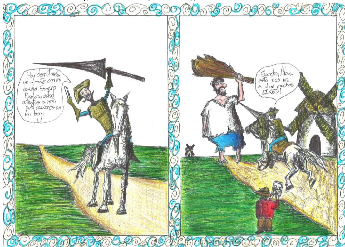
Figura 10 – Produção de charge, tema redes sociais