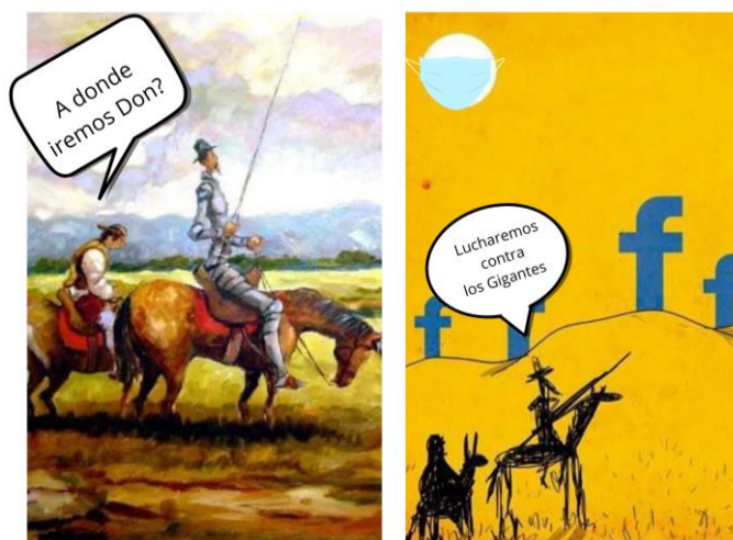
Figura 6 – Produção de charge, tema redes sociais