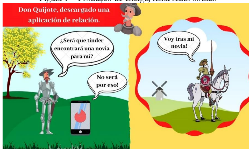
Figura 1 – Produção de charge, tema redes sociais