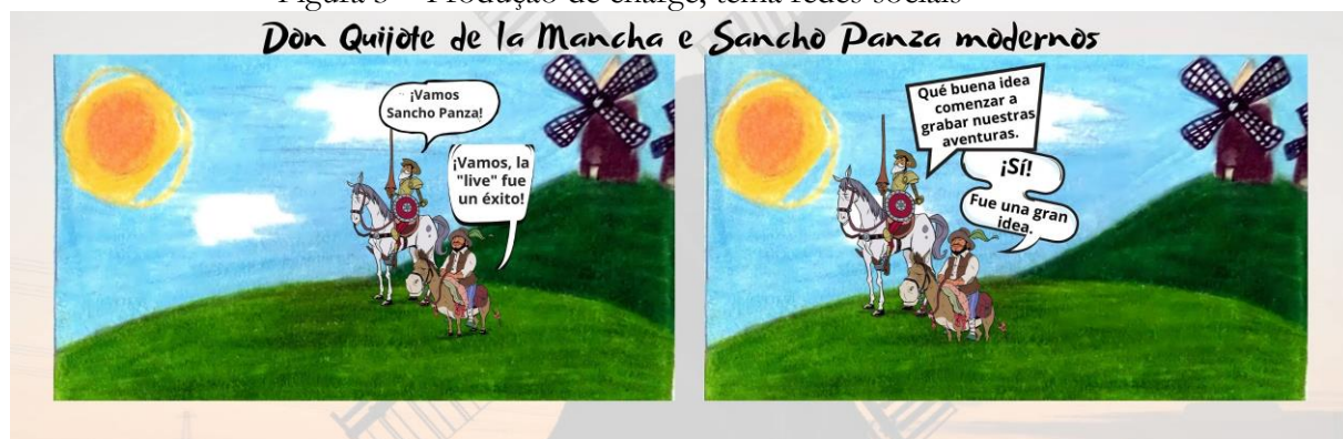
Figura 3 – Produção de charge, tema redes sociais