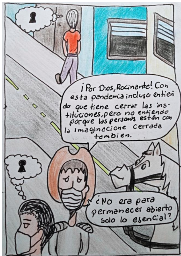
Figura 9 – Produção de charge, tema pandemia.