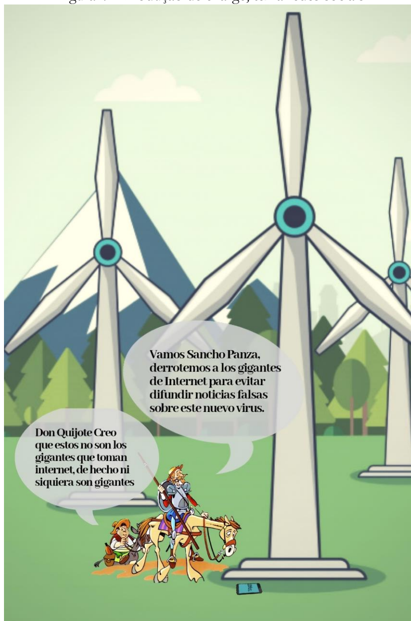
Figura 4 – Produção de charge, tema redes sociais