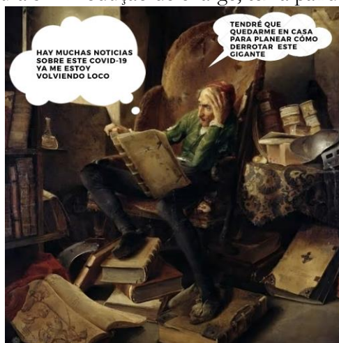
Figura 5 – Produção de charge, tema pandemia