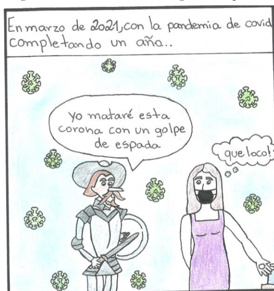
Figura 8 – Produção de charge, tema pandemia