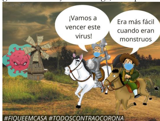
Figura 7 – Produção de charge, tema pandemia