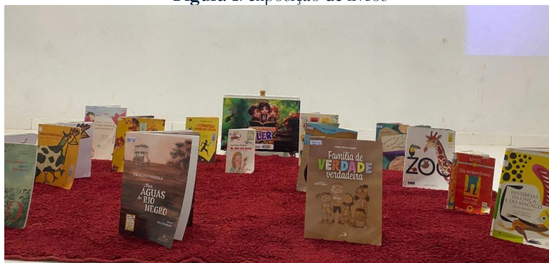
Figura 1: exposição de livros