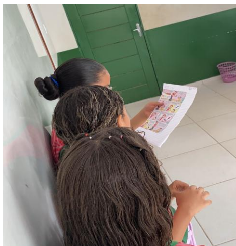
Figura 2: Socialização