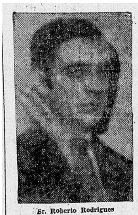
Figura 1 - Foto de Roberto Rodrigues

Fonte: DIÁRIO CARIOCA, n. 439, 27 dez. 1929.