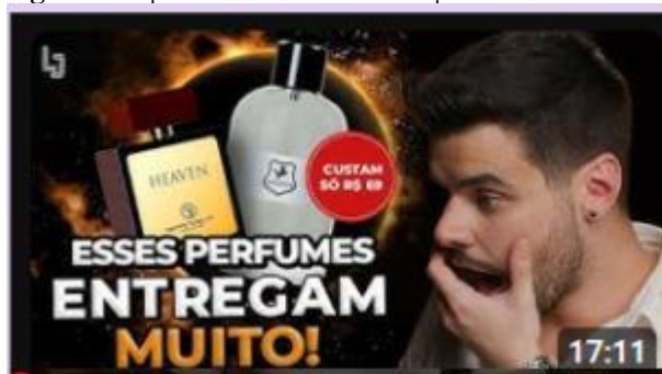
Figura 1: Captura de tela de vídeo da plataforma YouTube.