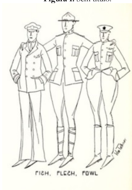
Figura 1. Sem título.