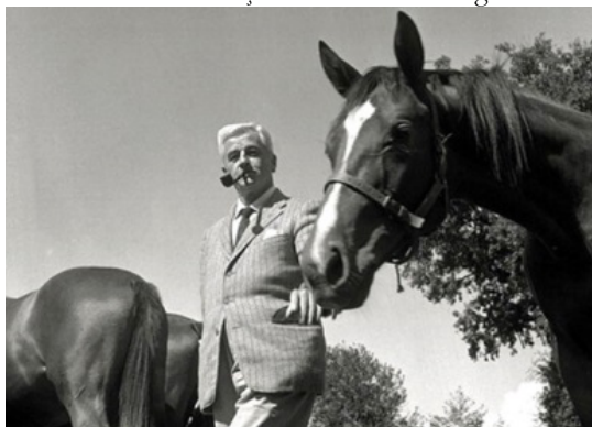
Figura 5. William Faulkner e sua criação de cavalos. Fotografia: Mario de Biasi, 1950.

Fonte: https://www.agefotostock.com/age/en/details-photo/william-faulkner-with-horses-the-american-writer-william-faulkner-smoking-a-pipe-among-some-horses-1950s/MDO-AA343994