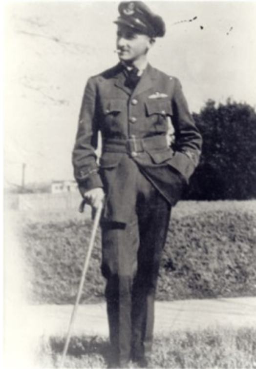
Figura 4. William Faulkner como cadete da Royal Air Force , 1918. Autor desconhecido.

Fonte: https://egrove.olemiss.edu/cofield/361/