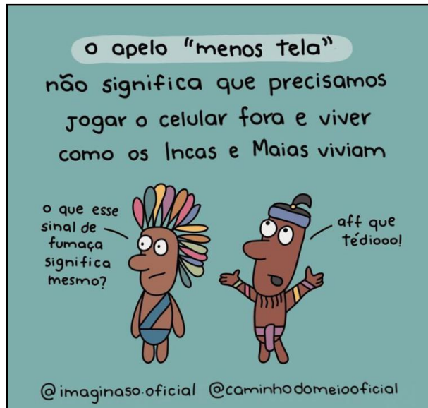
Figura 2: Exemplo de construção frase como lema (“menos tela”)

Além disso, o português apresenta muitas ocorrências da construção após a expressão ‘do tipo’, como pode ser ilustrado por: