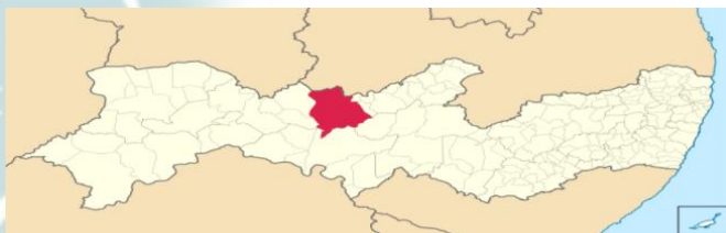
Mapa 1: Localização de Serra Talhada em Pernambuco

A cidade possui uma visibilidade no cenário nacional por ser considerada a terra de Lampião. Inserida na mesorregião do sertão de Pernambuco, Serra Talhada juntamente com outras dezesseis cidades constituem a microrregião do sertão do Pajeú.