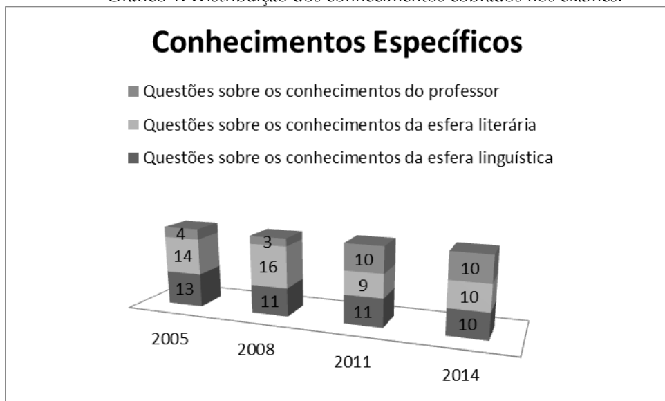
Gráfico 1. Distribuição dos conhecimentos cobrados nos exames.