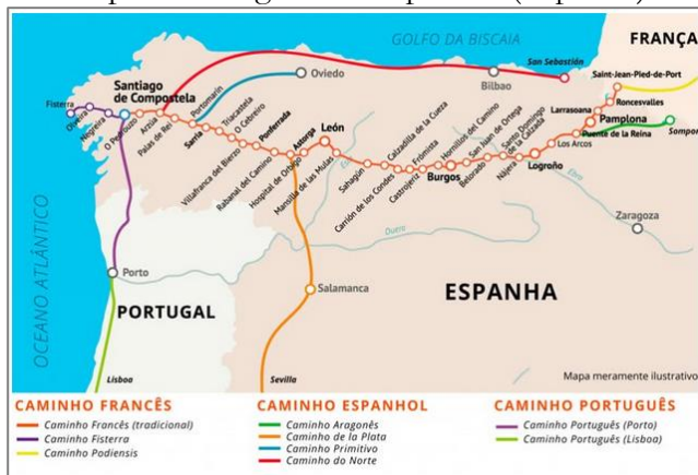
Figura 1 – Possíveis rotas para Santiago de Compostela (Espanha)

Nesse sentido, ao longo da Idade Média, foram três as grandes peregrinações dos católicos: nos lugares santos por onde transcorreu a vida de Jesus; na cidade de Roma e os túmulos dos apóstolos São Pedro e São Paulo e “Compostela, porque o túmulo do Apóstolo Santiago apareceu espontaneamente no século IX. Estas romarias caracterizavam-se por uma grande afluência e pelo facto de virem pessoas de todo o mundo, independentemente das grandes distâncias que tinham de percorrer” 10 (MATEOS; ROSSI, 1997, p. 5, trad. livre). Atualmente, a peregrinação à Santiago de Compostela pode ser realizada por três macro vias, com as suas devidas variações: i) o caminho Francês, o mais tradicional, chegando a 800 km de extensão e tem duração média de 25 e 35 dias de caminhada; ii) o caminho Espanhol, podendo chegar a 825 km e 35 dias de caminhada, caso o peregrino prefira o chamado ‘Caminho do Norte’; e iii) o caminho Português, com 250 km e duração entre 12 ou 13 dias. As rotas podem ser evidenciadas no cartograma a seguir.