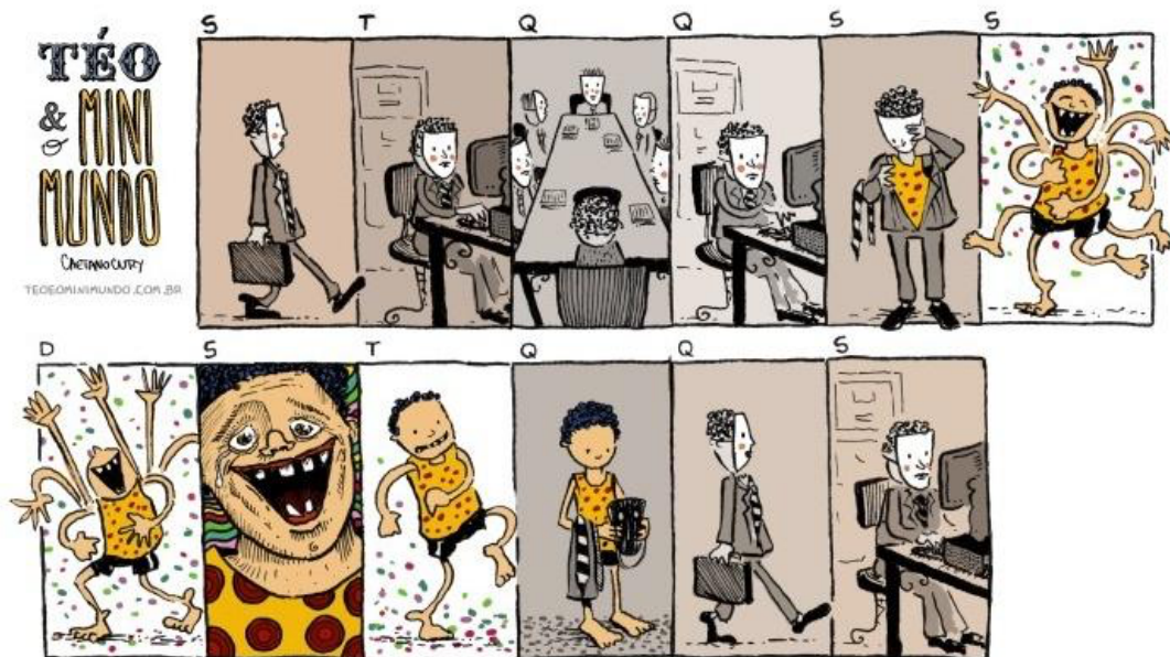
Figura 2: Máscaras de carnaval