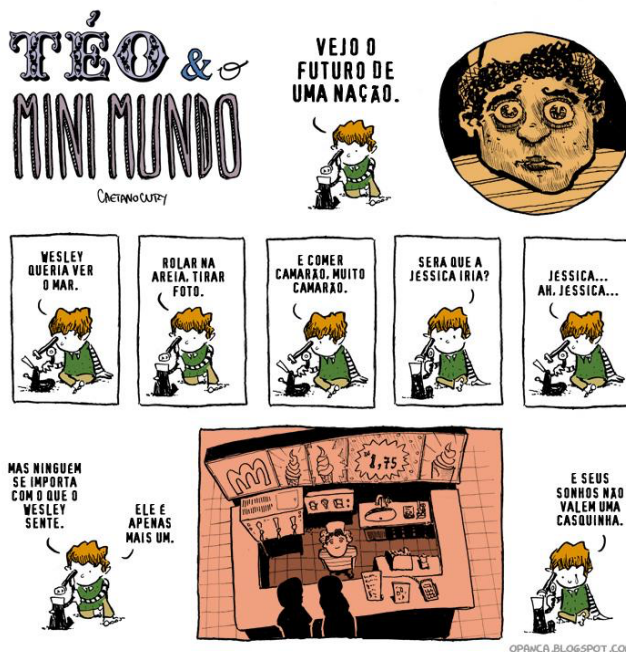
Figura 5: Wesley