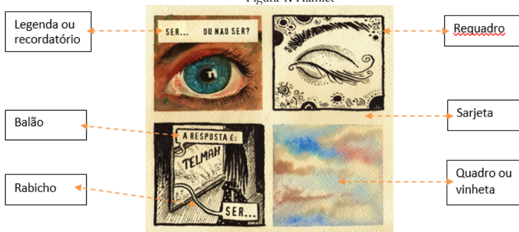
Figura 1: Hamlet

Para a construção de uma tira em quadrinhos, retomamos alguns quadros de uma tira de Caetano Cury para apresentarmos alguns dos elementos que constituem esse gênero em quadrinhos. Vejamos: