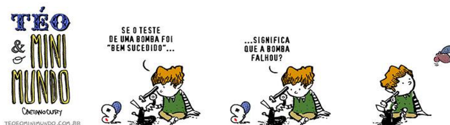
Figura 3: Bem sucedido