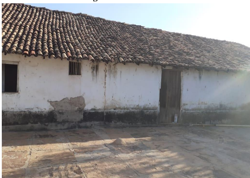
Imagem 1 Casa grande do coronel Alcides na localidade Barreiros

Sendo assim, podemos verificar que as fotografias são de suma importância e têm grande relevância em uma pesquisa bibliográfica, pois pode aguçar as lembranças dos expectadores e essas recordações são interpretadas e refletidas de diversas maneiras, dentro de um trabalho acadêmico. Nessa perspectiva, segue alguns registros fotográficos feitos no decorrer da pesquisa, referentes à casa grande do Senhor Alcides do Rego Lages, localizado na região do Barreiro do Alcides município de Barras-Piauí: