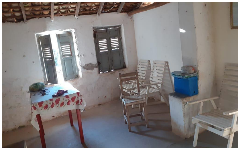
Imagem 2 Fotografia interna da casa grande do coronel (sala de visita)