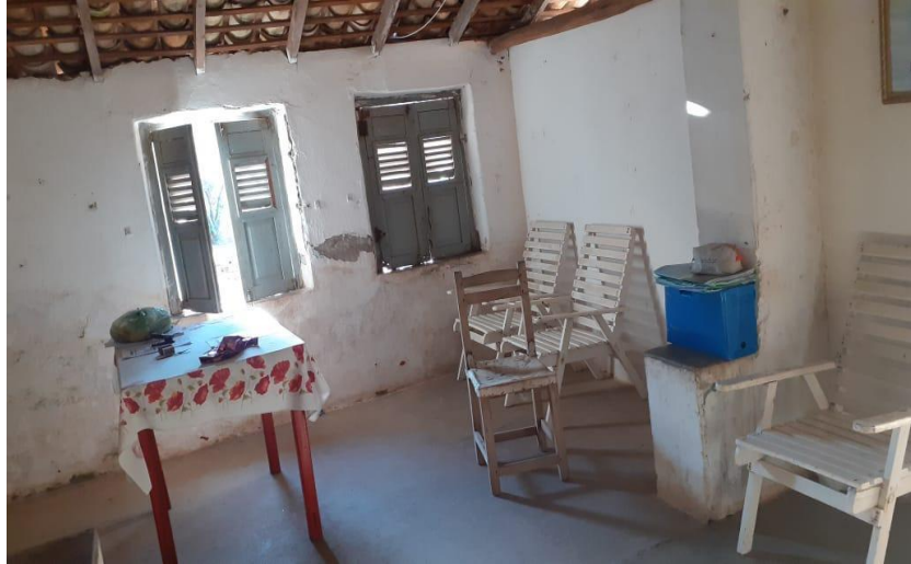
Imagem 2 Fotografia interna da casa grande do coronel (sala de visita)