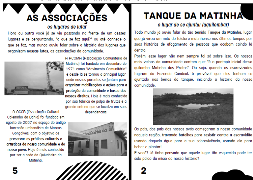
Imagem 1 “Os Lugares da Nossa História e Memória” utilizadas no dia da atividade extensionista

Fonte: Acervo pessoal. Páginas 05 e 02 da cartilha