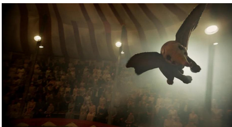
Figura 03: Dumbo voando no circo