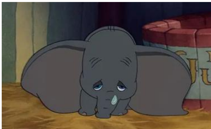
Figura 02: Dumbo se sentindo discriminado