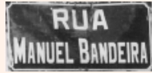
Rua Manuel Bandeira, em Feira de Santana. Uma homenagem de Eurico Alves ao poeta pernambucano.