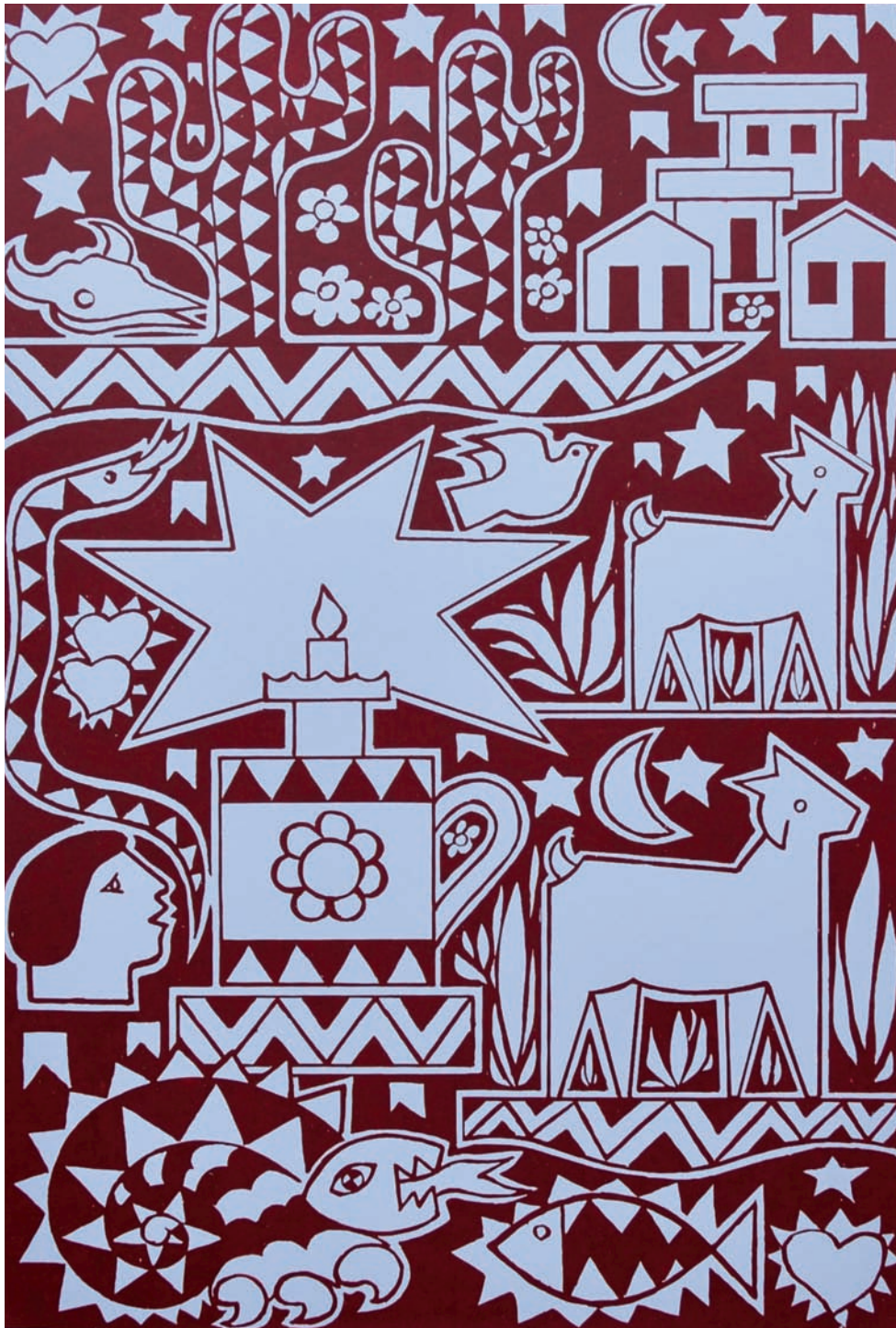
Cenas brasileiras 61 – 2007