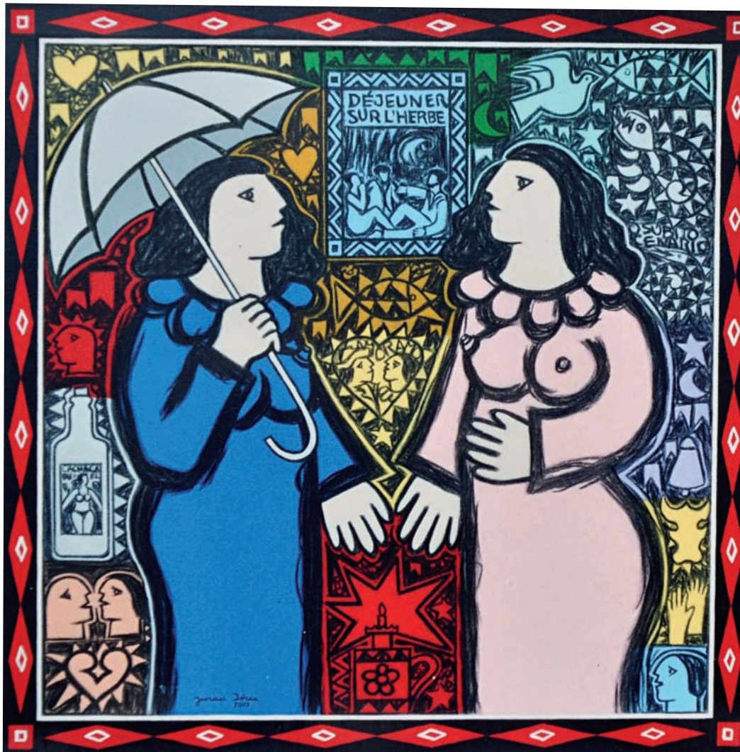
Fantasia sertaneja 236 – 2002