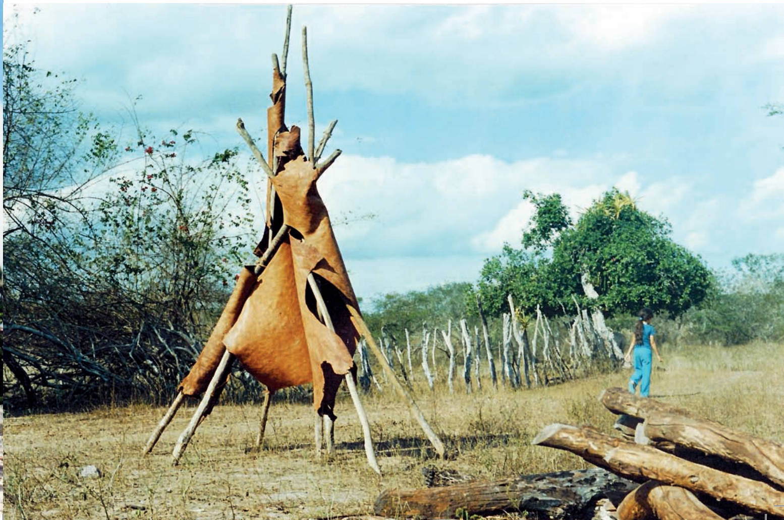
Projeto Terra – Escultura do Curral do Jericó – 2004