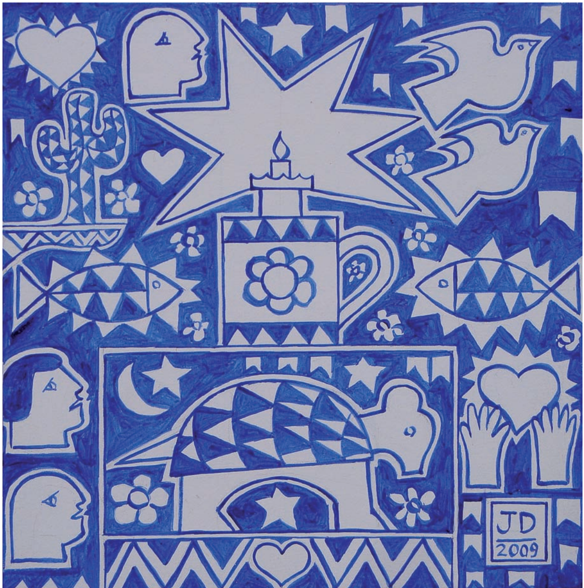
Cenas brasileiras 76 – 2009