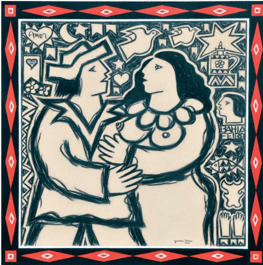
Histórias do sertão CXLIX – 2013