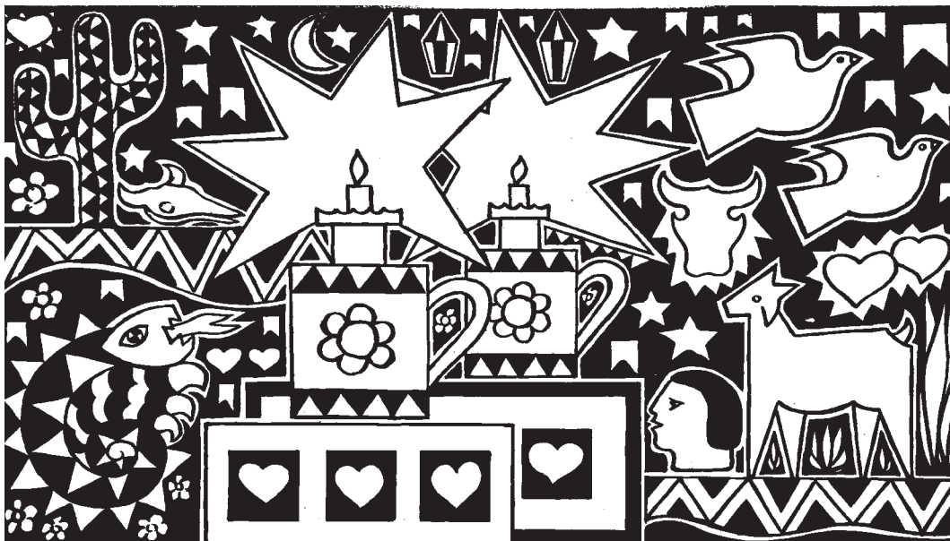
Cenas brasileiras 59 – 2007