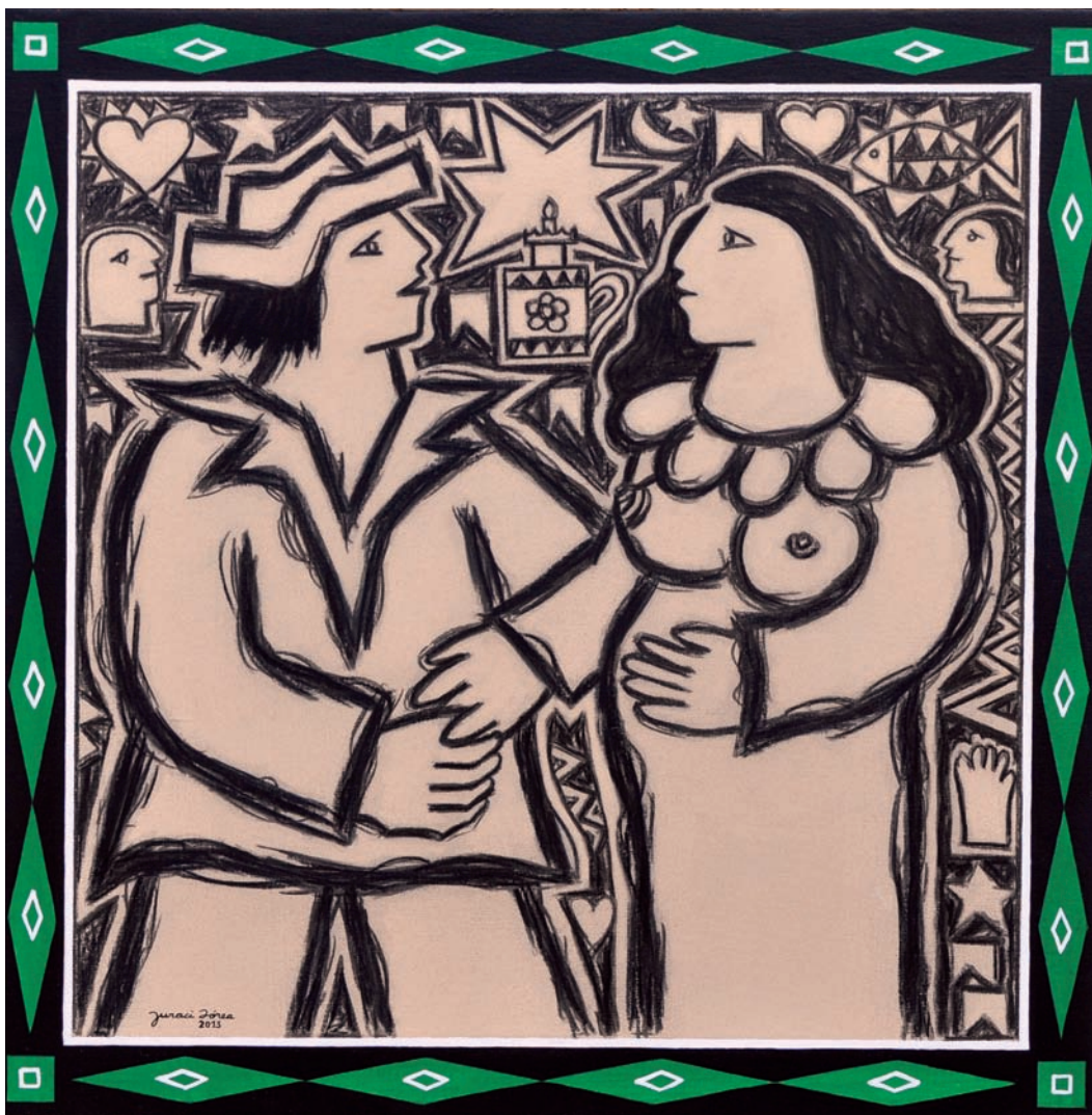
Histórias do sertão CXLVII – 2013