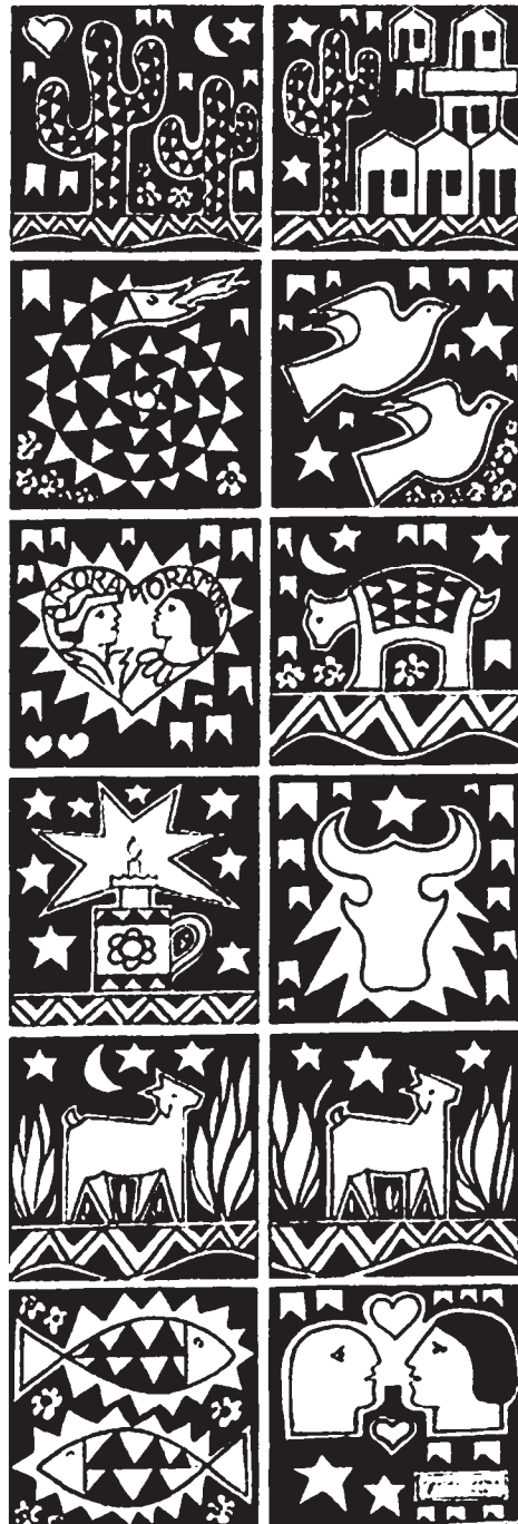
Cenas brasileiras 26 – 2005