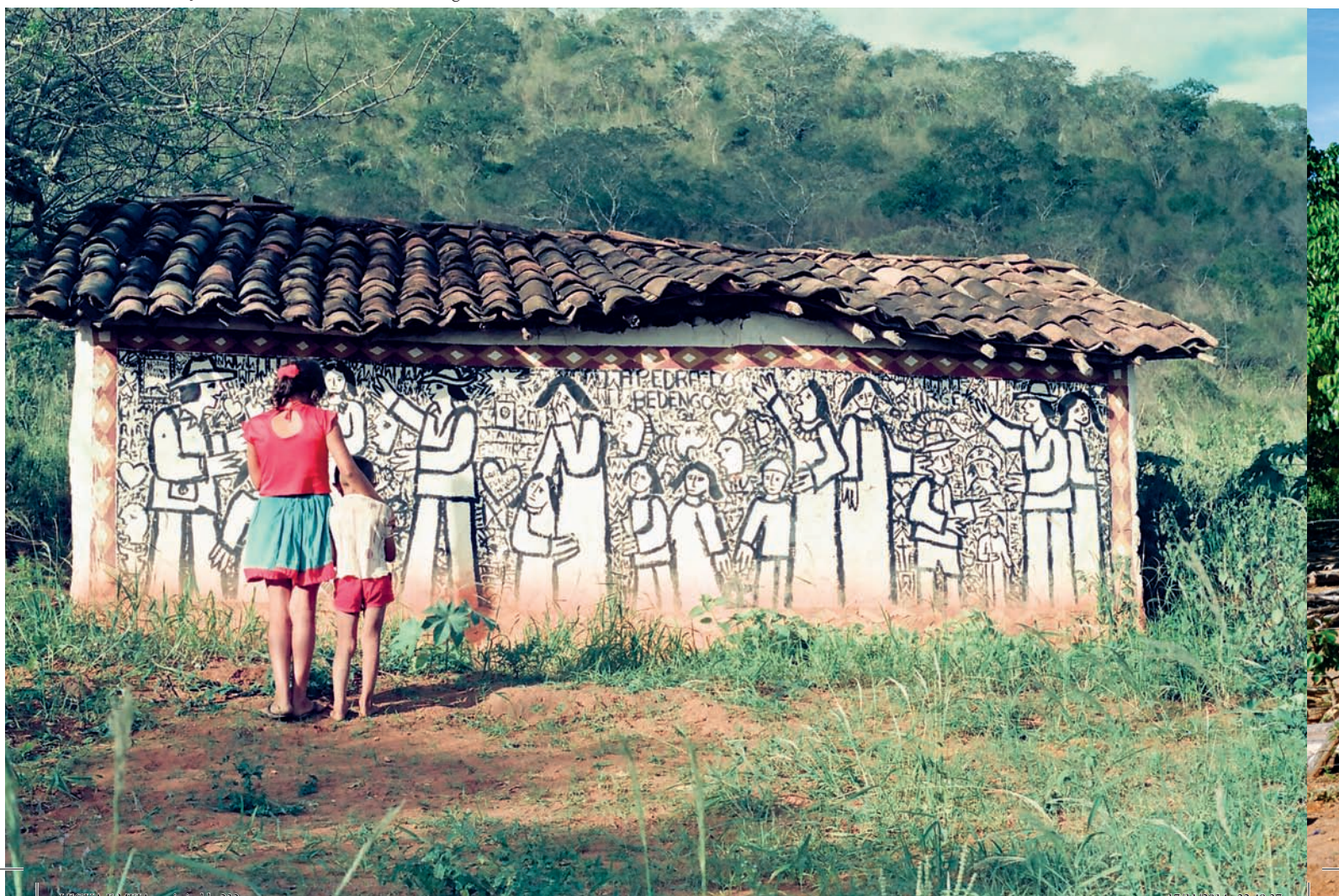
Projeto Terra – Mural da casa de Edwirges, Saco fundo – 1984