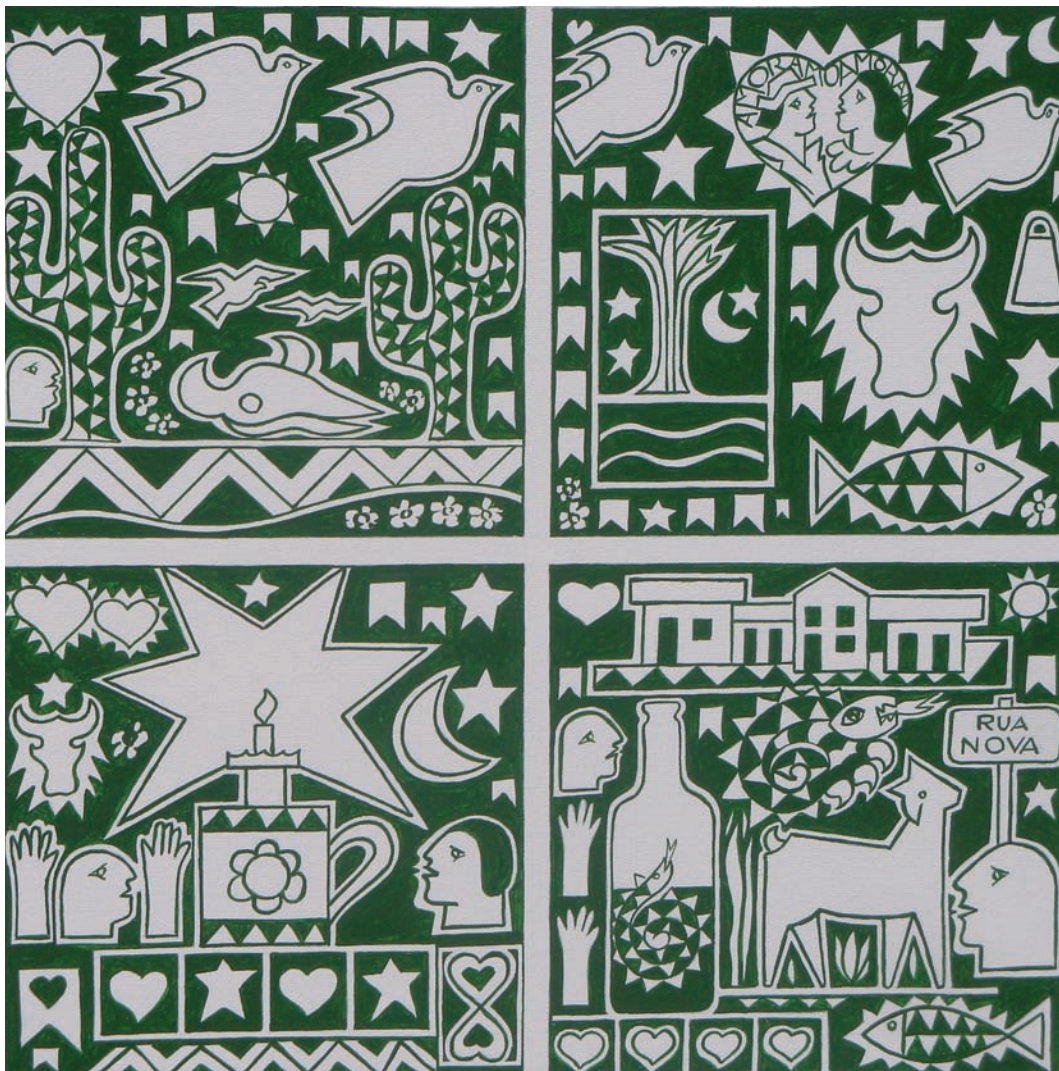
Cenas brasileiras 80 – 2009