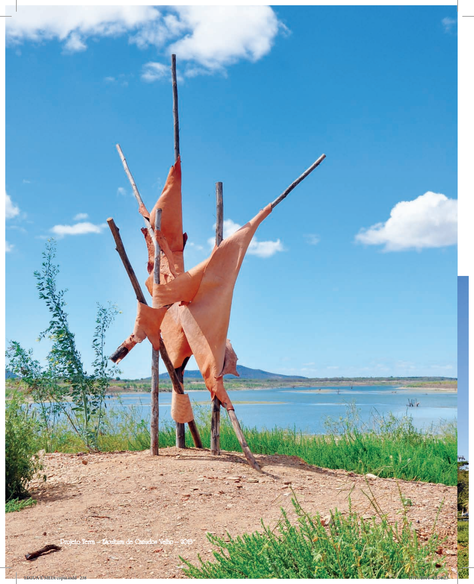
Projeto Terra – Escultura de Canudos Velho – 2013