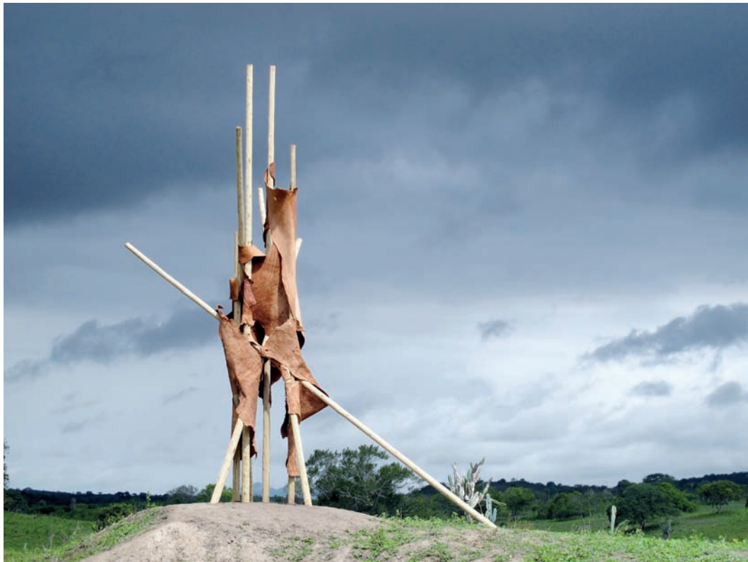
Projeto Terra – Escultura da Fazenda Fonte Nova – 2014