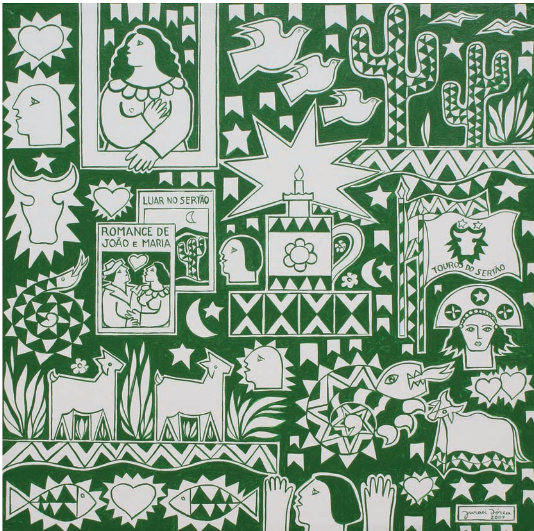
Cenas brasileiras 57 – 2007