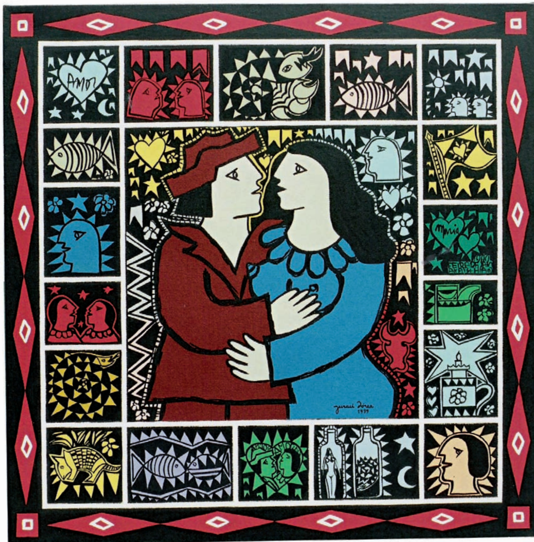
Fantasia sertaneja 207 – 1999