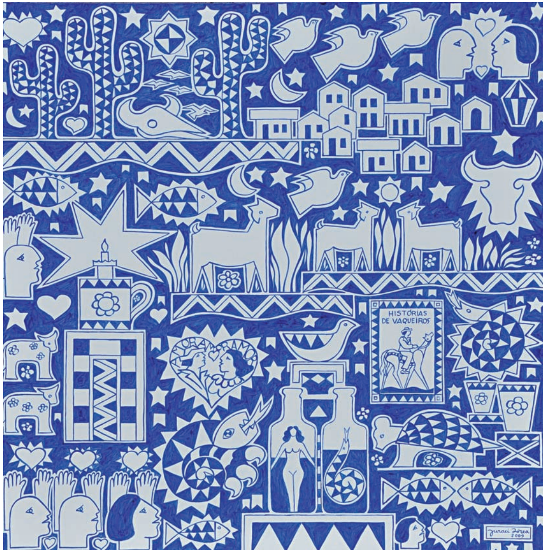
Cenas brasileiras 83 – 2009