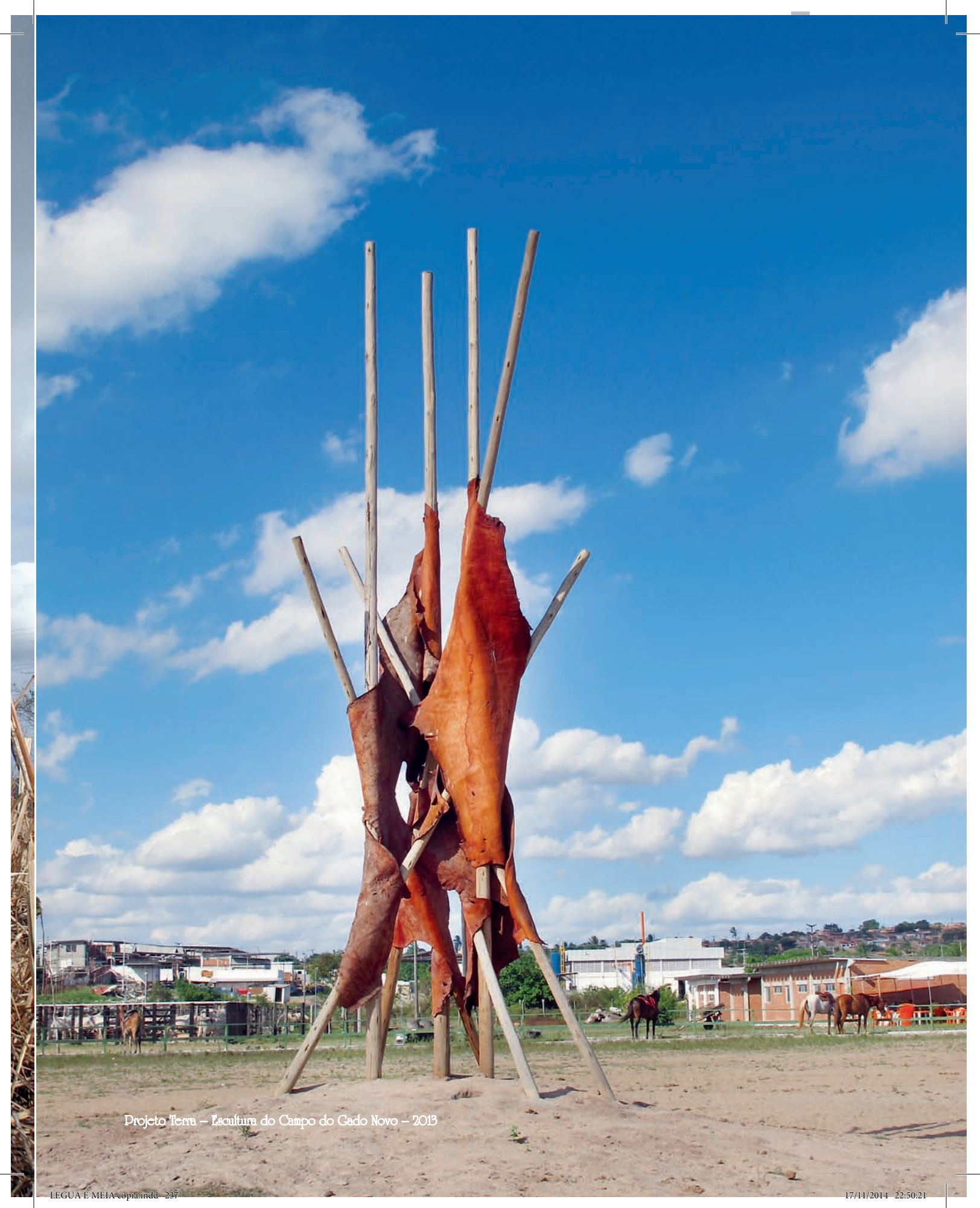
Projeto Terra – Escultura do Campo do Gado Novo – 2013