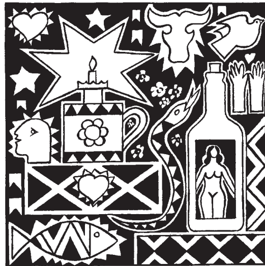
Cenas brasileiras 79 – 2009