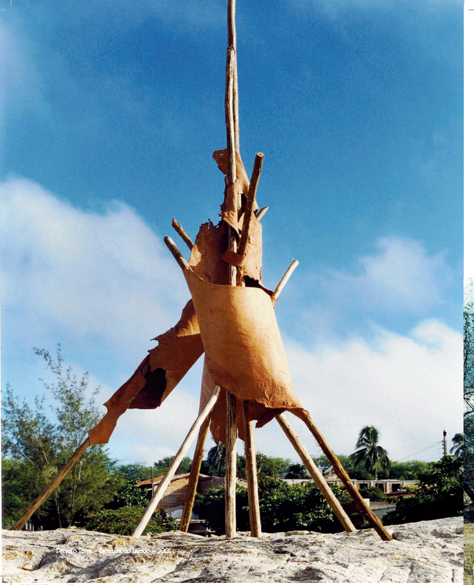
Projeto Terra – Escultura do Lajedo – 2001