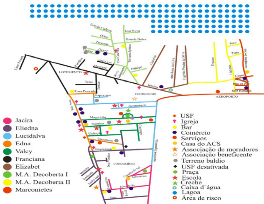
Figura 1. Mapa da área de abrangência da USF do Sítio Novo, Feira de Santana-BA, 2016

Na unidade de saúde do Sítio Novo, por exemplo, a maioria dos entrevistados foi do sexo feminino, naturais de Feira de Santana, que residiam no bairro há 20 anos, em média. A população foi predominantemente de adultos e idosos, com uma idade média de 44 anos. Vale ressaltar que 28,2% dos entrevistados se encontravam desempregados e 46,2% possuíam renda familiar de até um salário mínimo. Além disso, cerca de 92% relataram não possuir plano de saúde, sendo assistidos unicamente pelos serviços ofertados pelo Sistema Único de Saúde (SUS), o que reflete na alta adesão à USF.