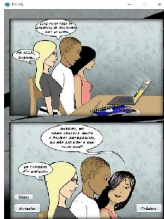
Figura 2: Sequencia em Quadrinhos