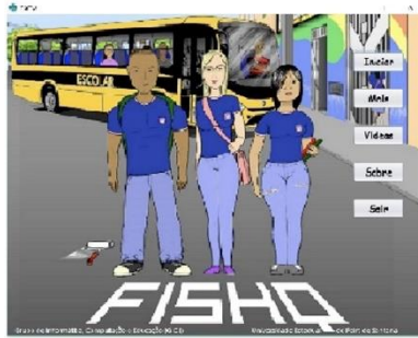
Figura 1: Tela Inicial

contendo a licença de software livre, que se refere a qualquer programa que pode ser usado, copiado, estudado, modificado e redistribuído sem nenhuma restrição.