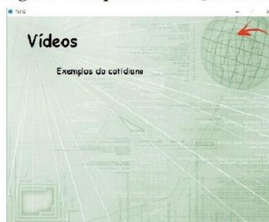
Figura 5: Tela "Videos"