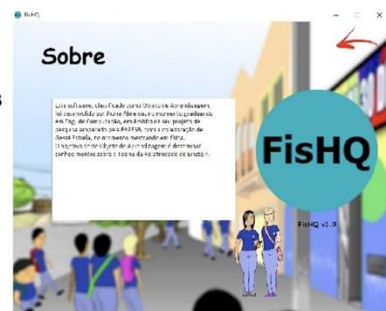
Figura 6: Tela "Sobre"