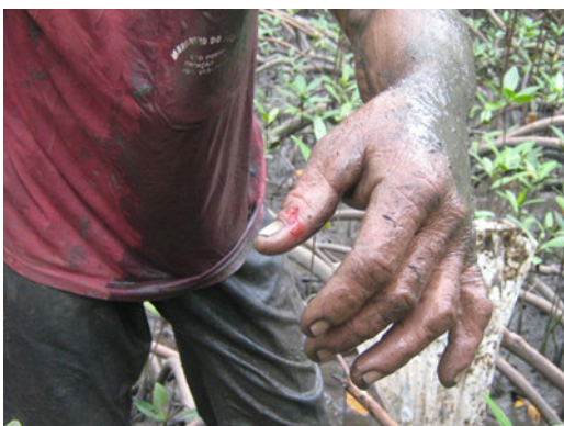
Figura 4. Caranguejeiro do tapamento, mostrando o corte no polegar advindo de estrepe do mangue.

movimento de agachar inúmeras vezes), micoses (manchas brancas na pele) e verminoses, que para alguns, são adquiridas através do contato com dejetos do guaxinim [ Procyon cancrivorus (Cuvier, 1798)], predador natural dos caranguejos, ou pelo contato com caranguejos.