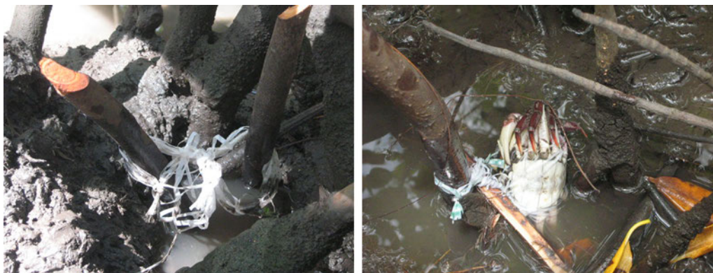
Figura 3. Redinha armada na abertura de uma toca de caranguejo-uçá (à esquerda) e animal aprisionado a uma redinha (à direita) no estuário do rio Mamanguape, Paraíba.

As doenças adquiridas no trabalho citadas pelos caranguejeiros foram: dores nas costas (devido ao