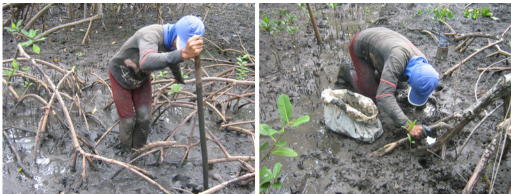
Figura 2. Caranguejeiro obstruindo a toca do caranguejo-uçá (à esquerda) e o caranguejo sendo retirado manualmente da toca (à direita) no manguezal do estuário do rio Mamanguape, Paraíba (fotos: José Mourão, 2007).

uso dessas quatro formas de captura em manguezais do estado da Paraíba (Alves & Nishida 2003; Nordi et al. 2009).