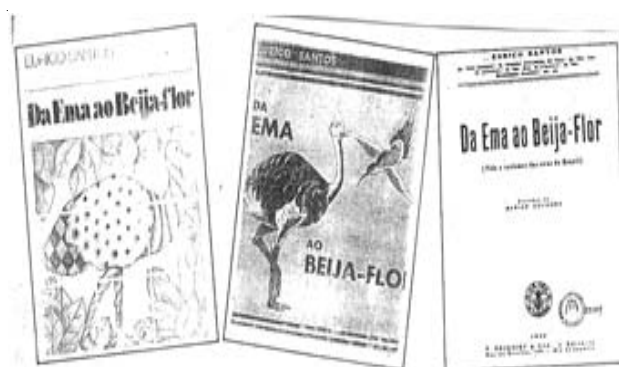
Fig. 2. Capa do primeiro livro da coleção Zoologia Brasileira (três edições).

“Pudesse eu contagiar aos meus leitores a admiração pelas aves, o interesse pelos seus costumes e o respeito pelas suas vidas, tão sagradas quanto as nossas, e teria conseguido o principal desejo que me guiou, ao