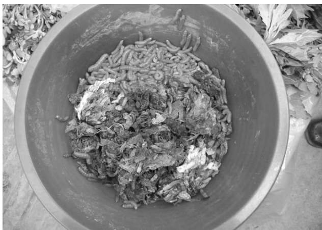
Fig. 6 Gusano rojo con alimento en una palangana.

El gusano rojo la traen de Tepetitlán (Sayula) Tula, Estado de Hidalgo ó de Jilotepec, Estado de México. La vendedora les puso alimento de la piña de maguey que lo denomina raspa (Fig. 6).