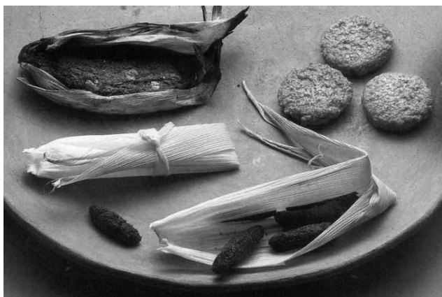
Fig. 5 Tortitas y tamales elaboradas con “ahuahutle” y “mosco”.