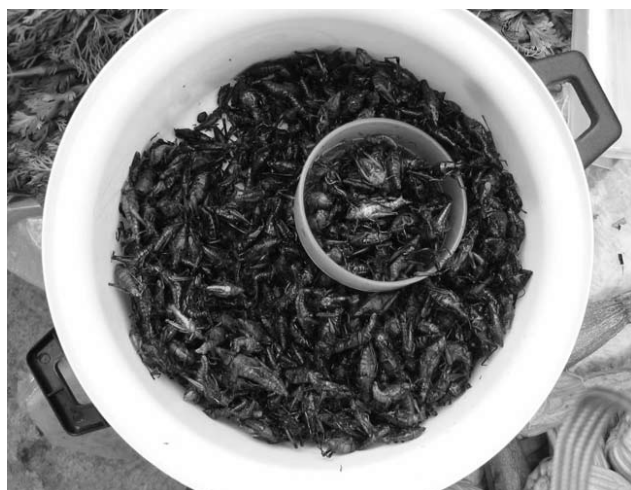
Fig. 2. Chapulines del género Sphenarium expuestos en el mercado.

Comentan que saben a carne de puerco o a chicharrón incluso que “comiendo chapulines para que quieren carne de puerco”.