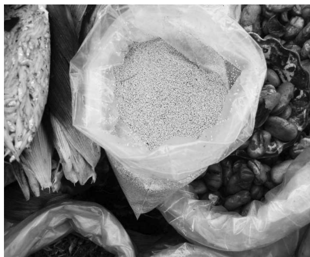
Fig. 4. “Ahuahutle” almacenado en bolsas de plástico listo para su venta.

El término “ahuahutle” proviene del náhuatl: “atl”- agua, “huautli” - bledos: “bledos del agua”. Es un conjunto de huevecillos de hemípteros acuáticos de las familias Corixidae y Notonectidae (Fig. 4). La medida que corresponde al contenido de una bolsa de plástico, la venden a $100.00 o $90.00, lo traen del Lago de Texcoco, Estado de México, la gente menciona que su sabor es semejante al caviar de los peces, y que su “proteína es muy buena y que es mejor que el viagra”.