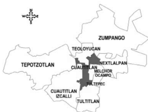
Fig. 1. Localización geográfica del municipio Cuautitlán de Romero Rubio.

Este Estado posee 121 municipios. En la Fig. 1 se muestra la ubicación del municipio denominado Cuautitlán de Romero Rubio.