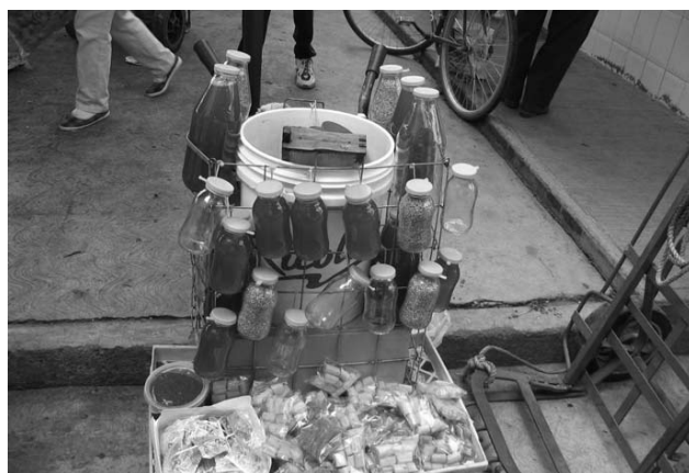
Fig. 8 Miel en panal y en diversas medidas para su venta.

En este caso se encuentran a la venta sus productos como la miel. Había 3 o 4 vendedores en carretillas o en carritos móviles que se colocan en un lugar determinado en la calle principal del mercado, o bien que mueven los productos tanto afuera como dentro del mercado. Se ofrecen en envases de vidrio, el litro cuesta $48.00 y el cuarto $15.00 o $25.00, dependiendo de la localidad de la cual la traen, o bien se venden en recipientes de plástico de diferentes capacidades. Uno de los jóvenes y una de las señoras que la venden mencionaron que la traen de Ixtapa de la Sal, Estado de México o de la ciudad de Toluca, que precisamente es la capital de éste Estado (Fig. 8).