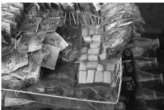
Fig. 9. Dulces elaborados con miel.

panalitos o de barrilitos los venden $5.00 la bolsita o a tres bolsitas por $10.00 (Fig. 9)